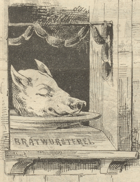
Illustration deutscher Klassiker.

Und so lag er eine Leiche Eines Morgens da, Nach dem Denker noch das gleiche, Stille Antlitz sah.