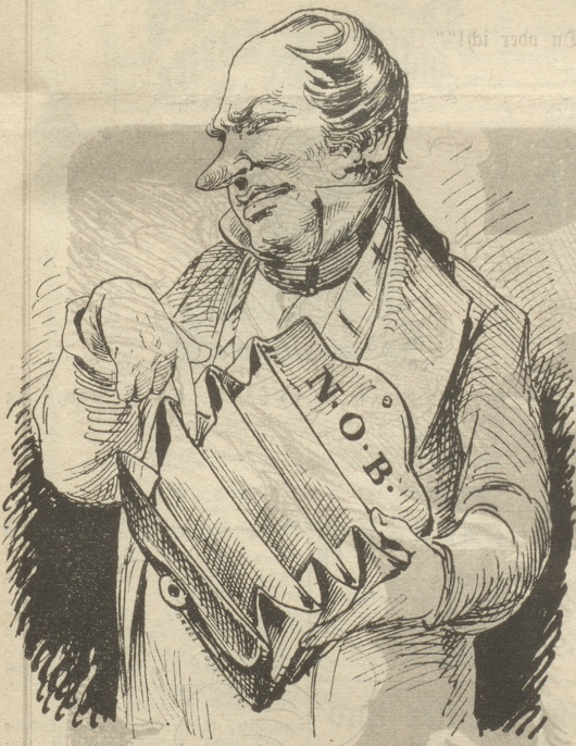
„Ich habe nun den Grund gefunden!“

Noch immer und überall studirt man darüber nach, woher die leidige Keifis wohl gekommen sein möge, und leider war noch Niemand so glücklich, den wahren Grund derselben zu finden. Und doch ist es so leicht. Frage man nur Abends in den Cassenzimmern, und da wird man bald erfahren, daß es in vielen tönt: