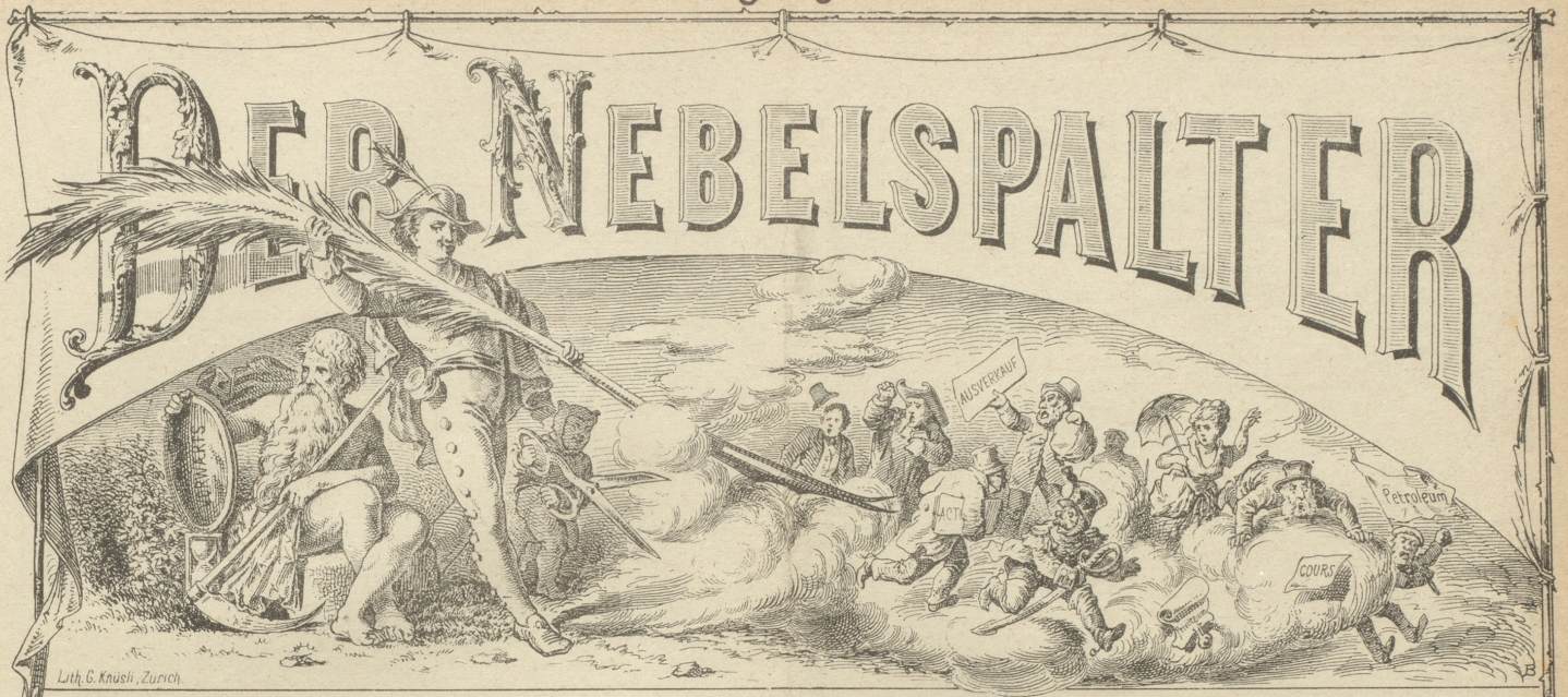
Lith. G. Knüsel, Zürich.