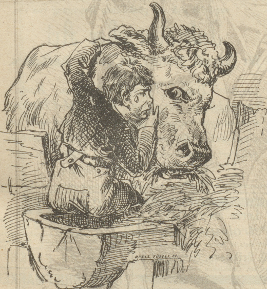
„Oh Lobe, hecht, jes häm'r fen Vater meh!“

In der Gemeinde B. lebte ein Vater mit seinem Sohne und beide liebten sich, wie sich Vater und Sohn nur lieben können. Friedlich und genüßlich bestellten sie mit ihrer Kuh, einem frommen und milchreichen Thier, ihr kleines Gut, das sie alle drei reichlich ernährte. Aber des Lebens ungetrübte Freude wird keinem Sterblichen zu Theil; der gute Vater erkrankte plötzlich und starb nach wenigen Tagen. Unendlich war der Schmerz des guten Sohnes, heiße Thränen rollten über seine Wangen und überwältigt von dem namenlosen Weh des Verlassenseins, ging er in den Stall, umhastete den guten „Mled“ und sprach mit klagender Stimme: