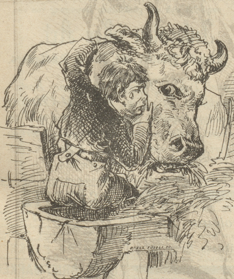
„Oh Lobe, hecht, jes häm'r fen Vater meh!“

In der Gemeinde B. lebte ein Vater mit seinem Sohne und beide liebten sich, wie sich Vater und Sohn nur lieben können. Friedlich und genüßlich bestellten sie mit ihrer Kuh, einem frommen und milchreichen Thier, ihr kleines Gut, das sie alle drei reichlich ernährte. Aber des Lebens ungetrübte Freude wird keinem Sterblichen zu Theil; der gute Vater erkrankte plötzlich und starb nach wenigen Tagen. Unendlich war der Schmerz des guten Sohnes, heiße Thränen rollten über seine Wangen und überwältigt von dem namenlosen Weh des Verlassenseins, ging er in den Stall, umhastete den guten „Mled“ und sprach mit klagender Stimme: