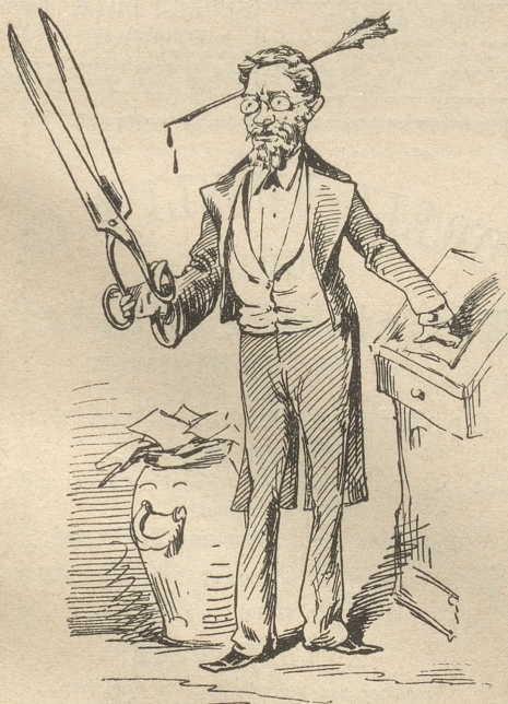
Ein schneidiger Redaktor!

Für eine täglich erscheinende politisch-religiös-demokratisch-liberal-konservativ-ultramontane Zeitung wird gesucht: