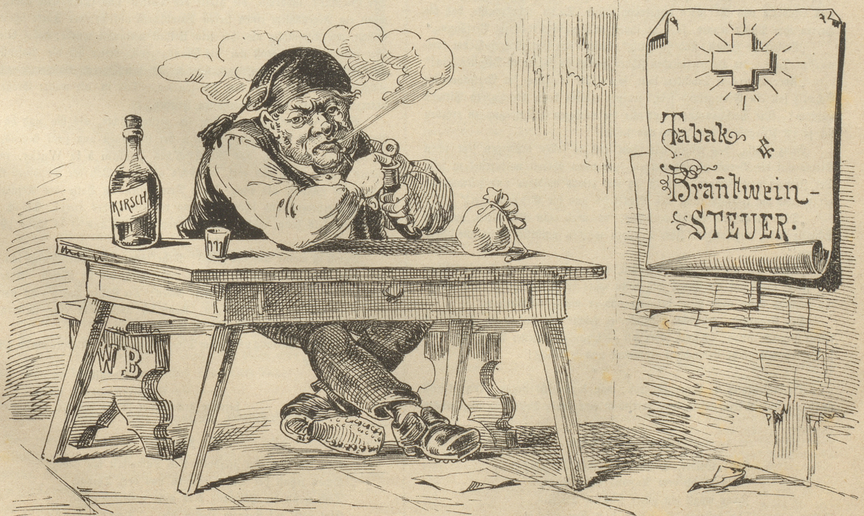
„Wenn mer Derfelb' nur nie bigenget, wo's sälbig usg'füglet hät!!“