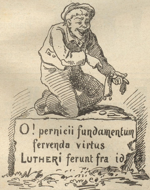
(Auflösung folgt in nächster Nummer)