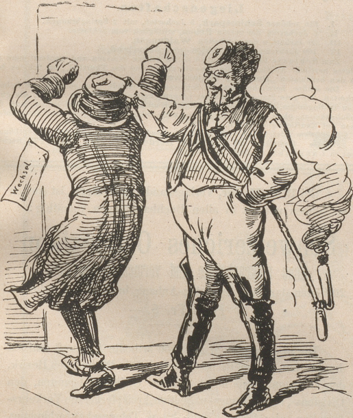
So nimm ihn hin! Dein Haupt will ich bedecken.