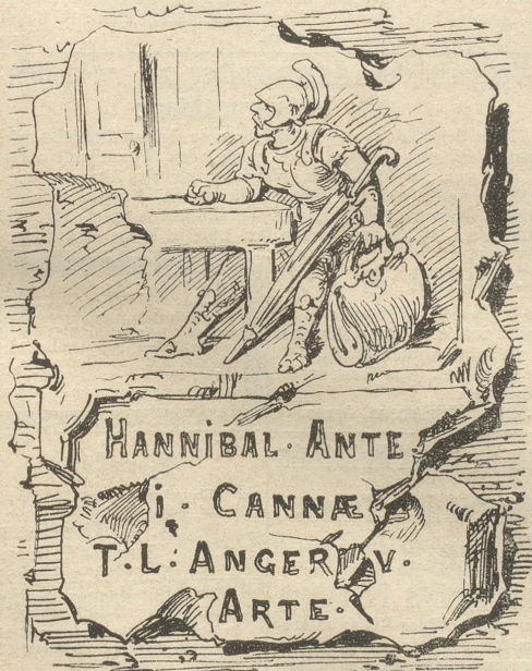
Auflösung folgt in nächster Nummer.