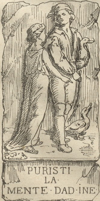
(Auflösung in nächster Nummer.)