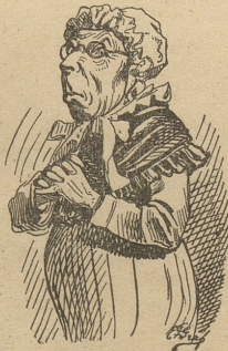
Das alte Weib.

War in der Jugend etwas leicht ich schon, Eint' ich im Alter dafür Spott und Hohn; Und Groß und Klein, sogar des Nachbar's Ränge, Heißt mich nicht anders als: die Brillen- schlange.