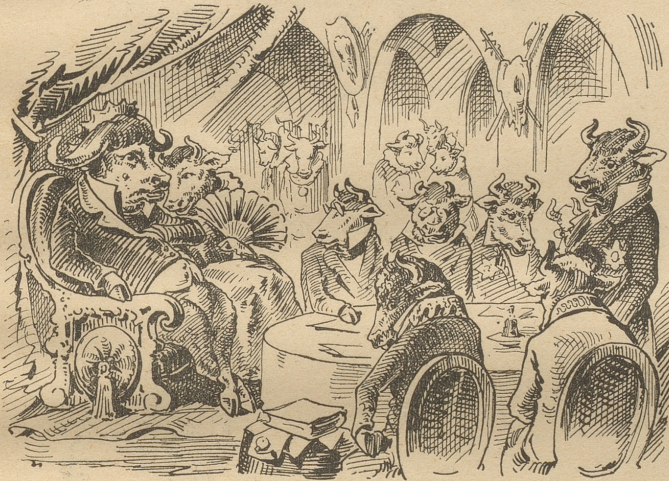
Die Rathssitzung der gesammten Büffelschaft.