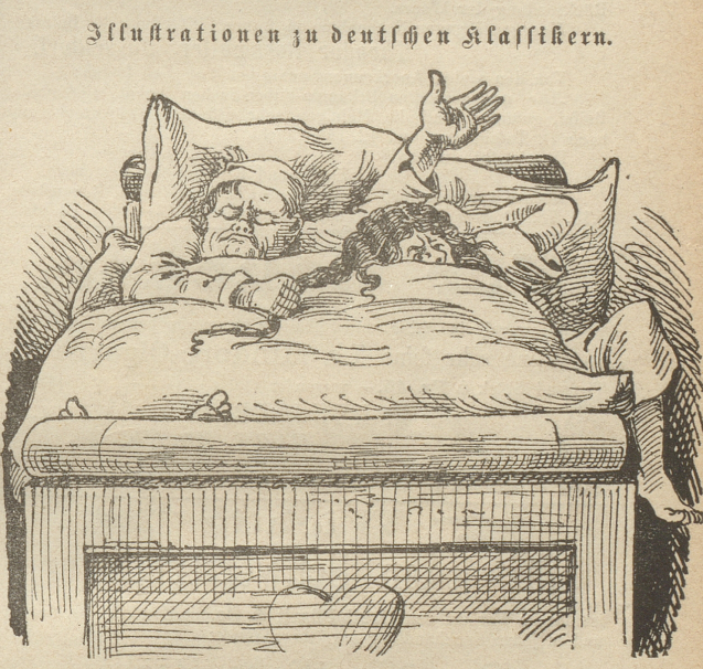
Illustrationen zu deutschen Klassikern.

Käsewurst ein pikanter, fetter, haltbarer Käse, versendet gegen Nachnahme franco Schweiz einschliesslich Verpack.: 7 Stück für 4 1/2 Reichsmark. 14 „ „ 8 „ „ 20 „ „ 10 „ „ A. Düsing, Görlitz.