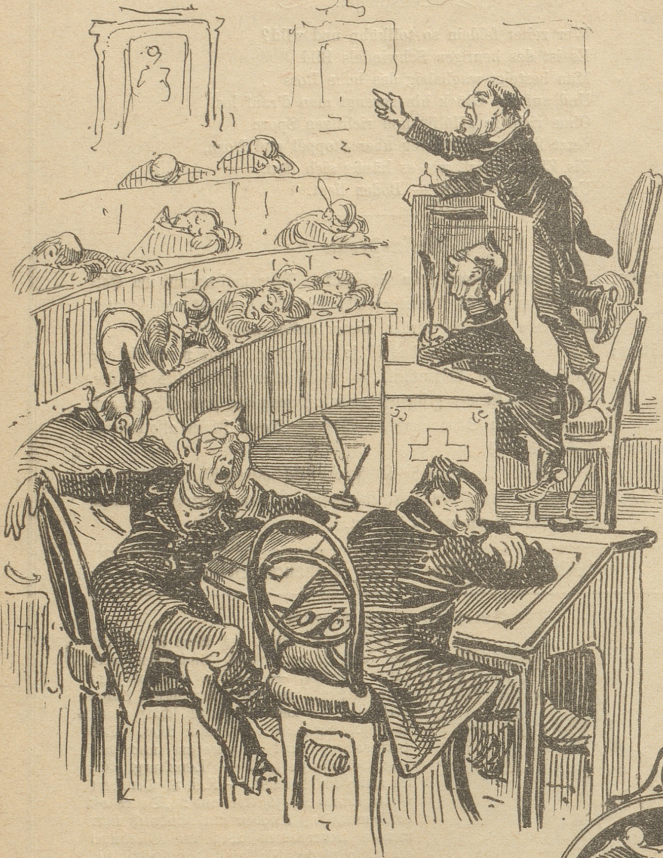
Bei uns schläft man ganz wonniglich;