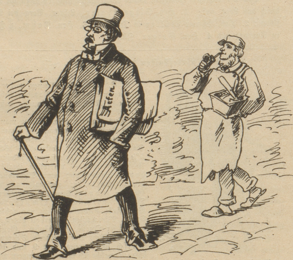
Beamter. O, daß ich doch ein Handwerker wär', die haben's gut!