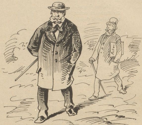
Kleingewerbler. Ach, ich wollt', ich wär' ein Beamter! Die haben's gut!