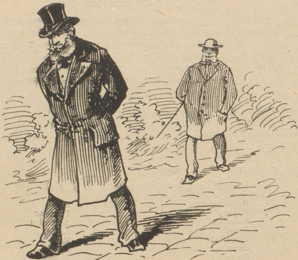
Großindustrieller. Ich wollt', ich wär' ein Kleingewerbler! Die haben's gut!