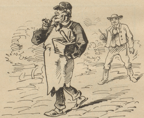
Handwerker. Am schönsten haben's doch die Arbeiter! Ich wollt', ich hätt's auch so!