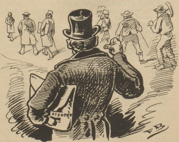
Steuereintnehmer. Da gehen sie Alle, die mir pflichtig sind. Die haben's gut! Ich wollt' auch lieber zahlen, als einnehmen!