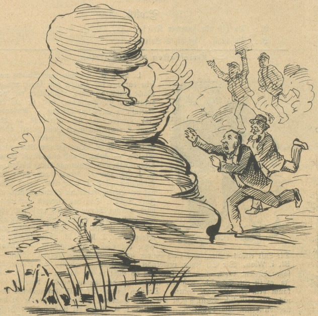
„Für die laufenden Gläubiger ist Nichts erhältlich.“