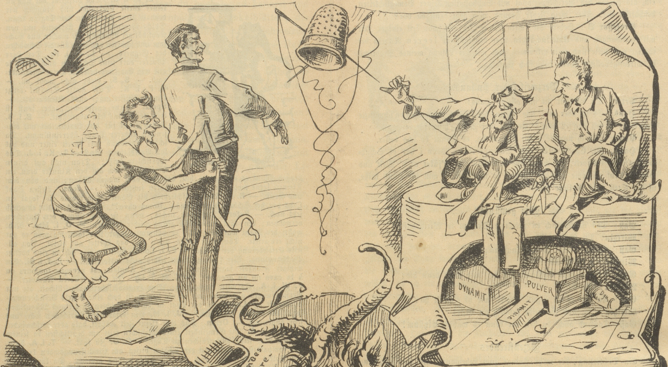
Gegen Dynamit. Sicherste Maassnahmen beim Maassnehmen.

wenn die Schneider alle Anarchisten sind.