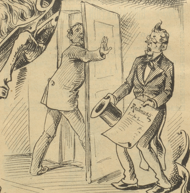
Das hat mit seinem Schrecken Der Dynamit gethan. — — —