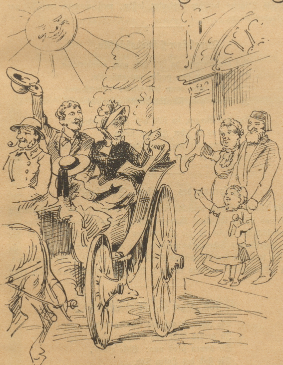
Freudlich und wohlgenuth zogen sie im Wagen aus bei Hitze und Sonnenschein, aber da kam er der Regen.