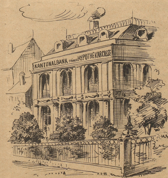
und jetzt macht sie derenwäg ein Gesicht.