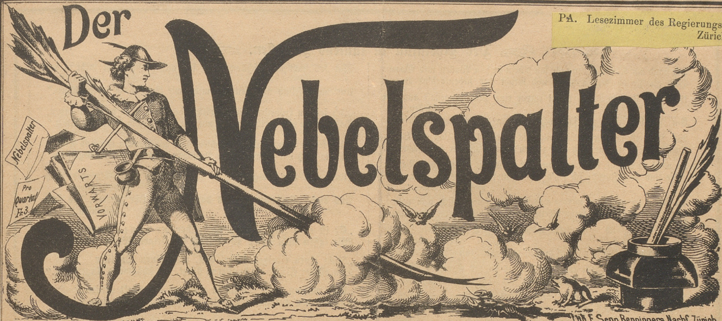
Ch. E. Senn Benningers Nachf. Zürich.

PA. Lesezimmer des Regierungsrathes, Zürich.