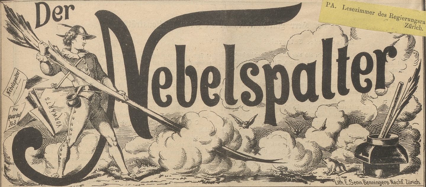
Lith. L. Senn Benningers Nachf. Zürich.

PA. Lesezimmer des Regierungsrathes, Zürich.