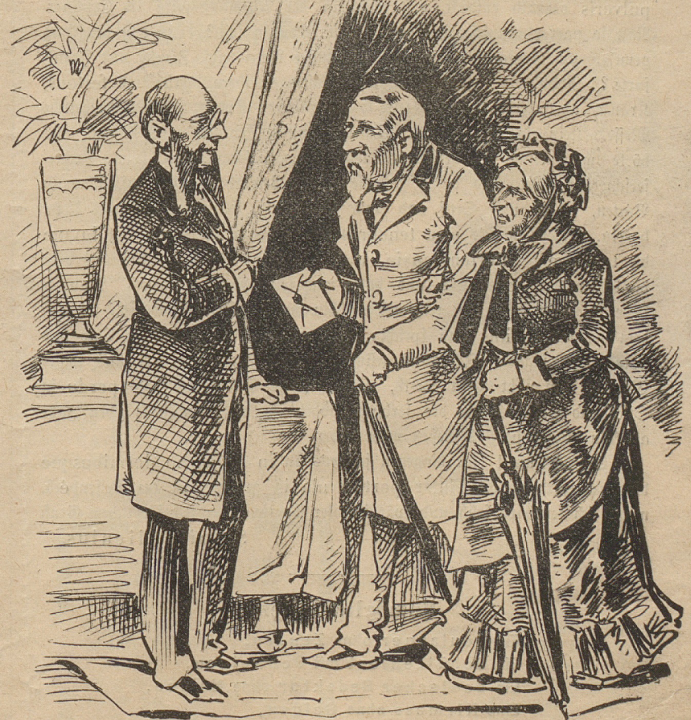
Die Eltern Boulanger's

haben dem Ferry »wüst« gesagt, meinte der richtige Politiker, als er las: »Boulanger schickte Ferry seine Zeugen!«