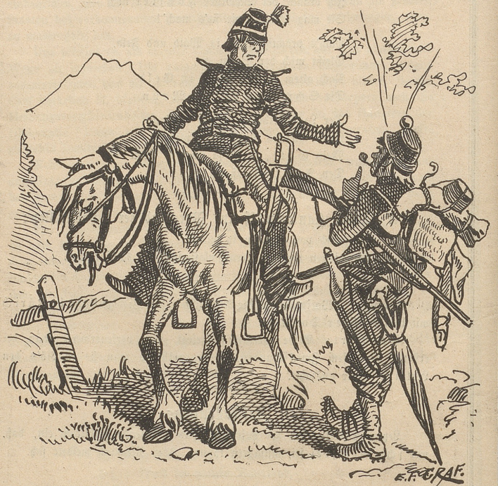
durch ausländische Brille.