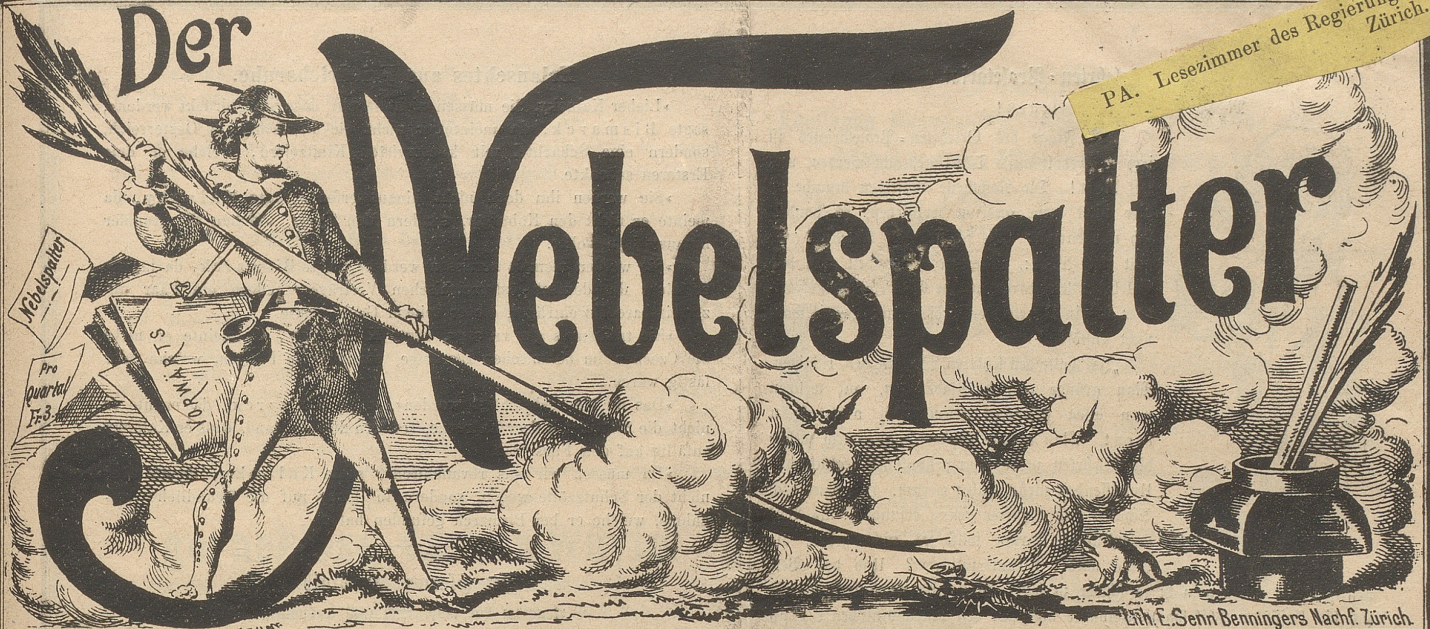
Ein. E. Senn Benningers Nachf. Zürich.

P.A. Lesezimmer des Regierungsrathes, Zürich.