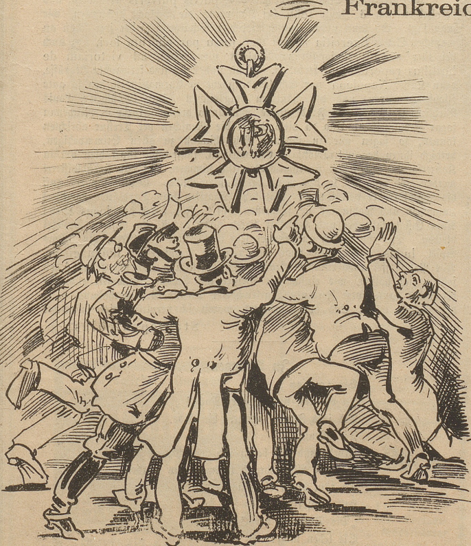
Erst kroch und drängte zu Kreuze Das Volk, Militär und Zivil!