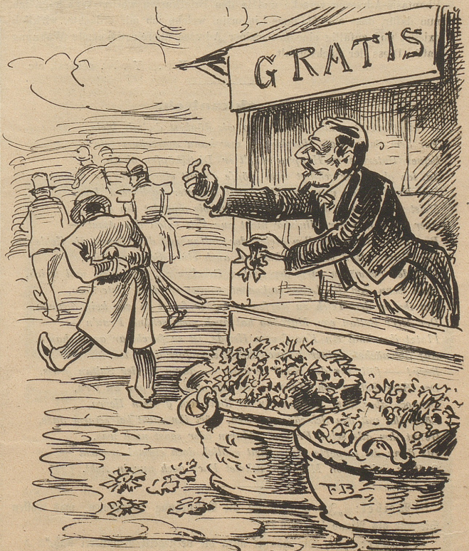
Was soll aus den Kreuzen dann werden, Wenn Niemand sie tragen mehr will?