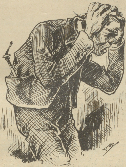
D, mi Grind!