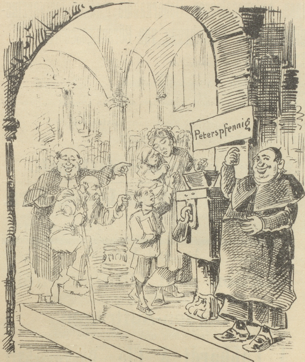
„Hier wird Nichts abgewiesen!“