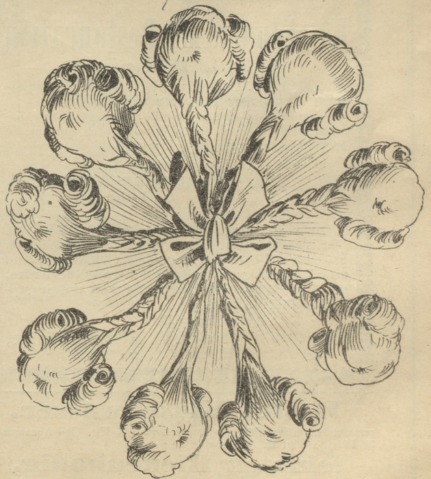
„Hoffentlich wird dieses naturgetreue Bild nach dem Vorschlage des schweizerischen Kunstvereins als eine voreilige Augenblicksaufnahme erklärt.“