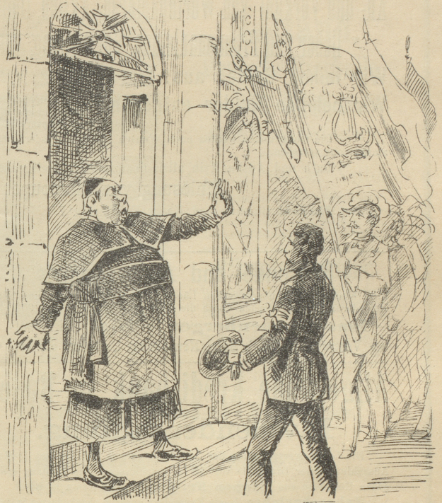
„Hier wird nicht gesungen!“