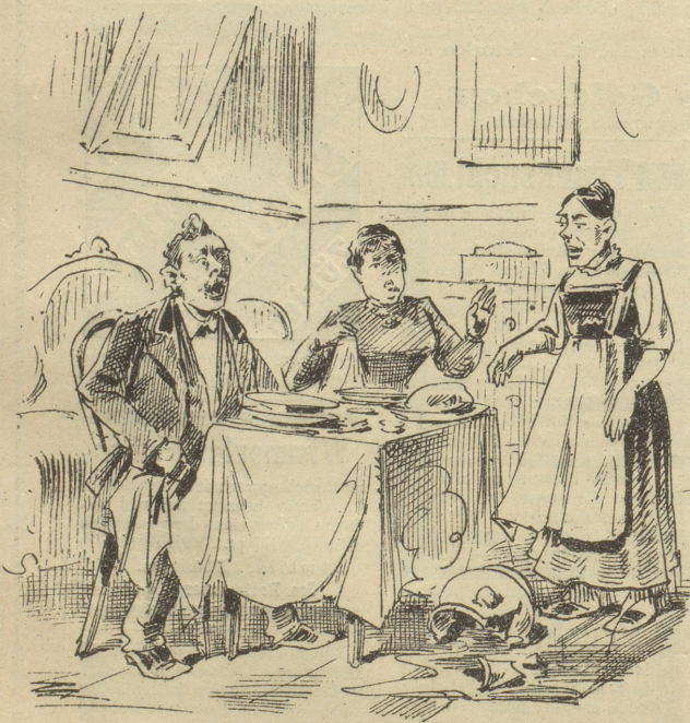
Hausfrau: „Unsere Pepi ist doch gar zu dumm! Zerschlägt sie die nage! neue Suppenschüssel, die ich erst gestern gekauft habe.“