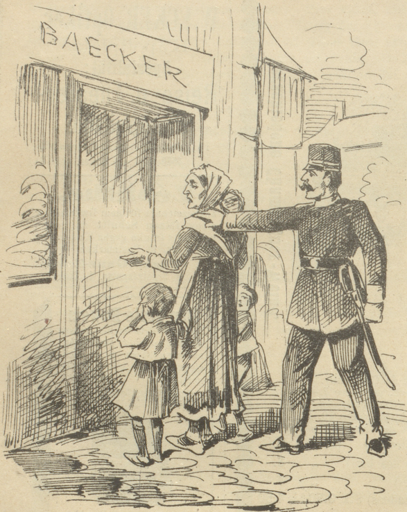
Wenn die Armuth für ihre Kinder Brod bettelt, so ist das ein Verbrechen.