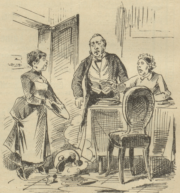
Hausfrau: „Mit unserer Manny ist's rein zum toll werden! Zerbricht sie die alte Suppenschüssel von unserer Großmutter selig.“