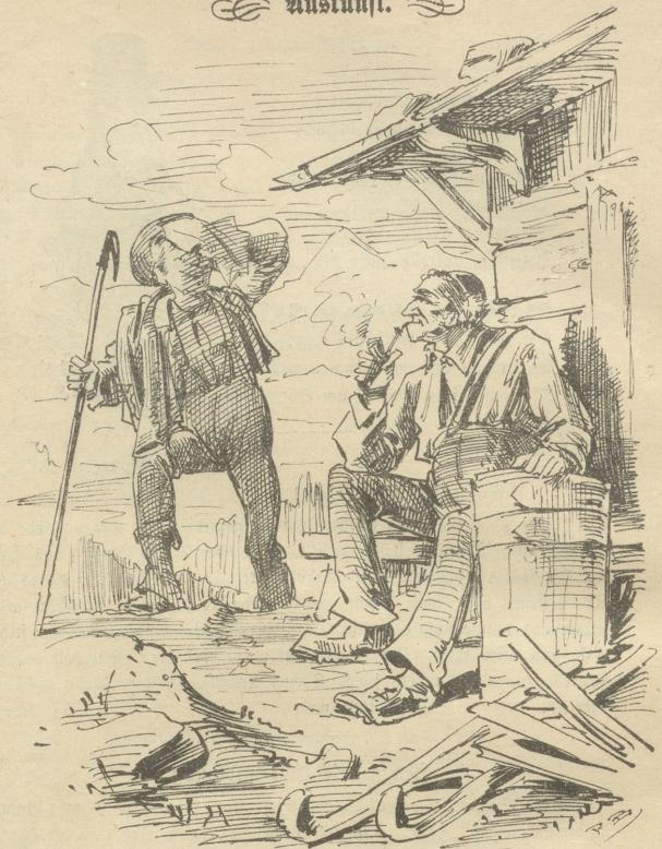
Fremder: „Hundsmüß' wird man, bis man da oben ist. Gibt's denn hier um diese Zeit keine Maulthiere und Esel mehr!“ Bauer: „Nein, die hat's nur, wenn die Fremden da find.“