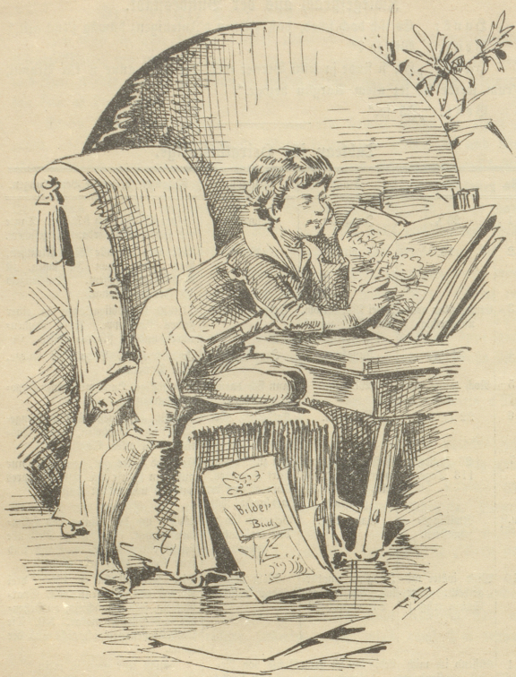
Knabe (Schlachtenbilder betrachtend): „Die Prüßä föttid an Obacht gäbe, wenn si schüßed; die mached ja allethalbe Todti!“