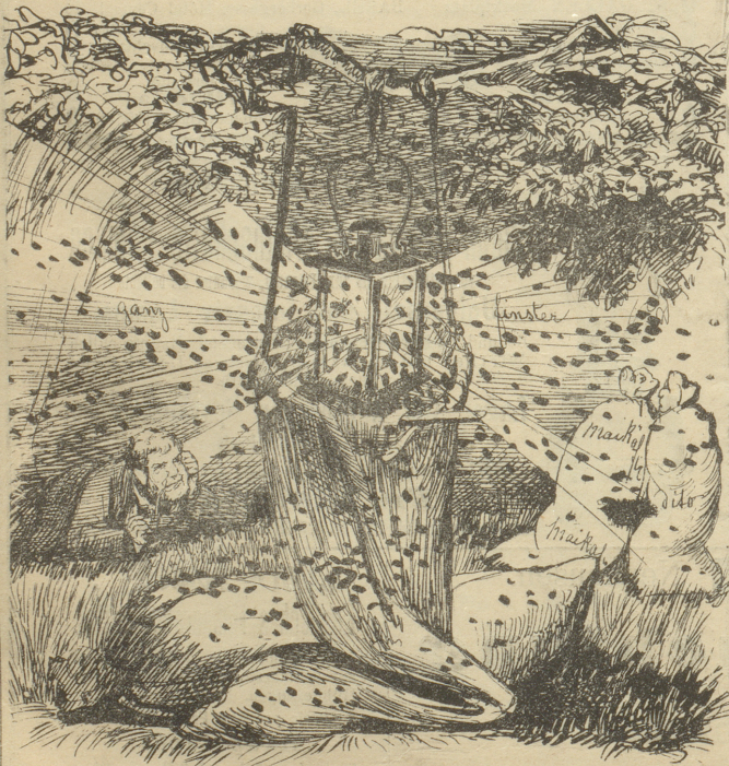
»Mit dem Licht fangen sie ganze Säcke voll lichtfreundliche maikäfer