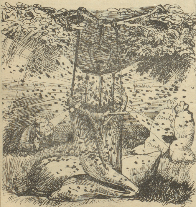
»Mit dem Licht fangen sie ganze Säcke voll lichtfreundliche maikäfer