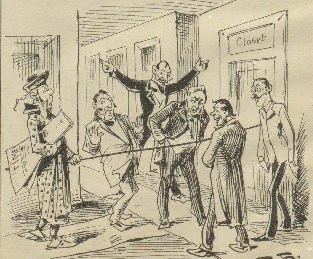
6. Engländer: »I drawn — ich hab Schnur spinnen — to find my way — zu finden den Wueg vom Closet to my Zimmer!“