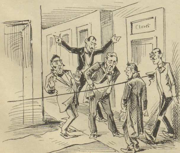
5. Preuße: „Nihilisten! Lumpenpack!“