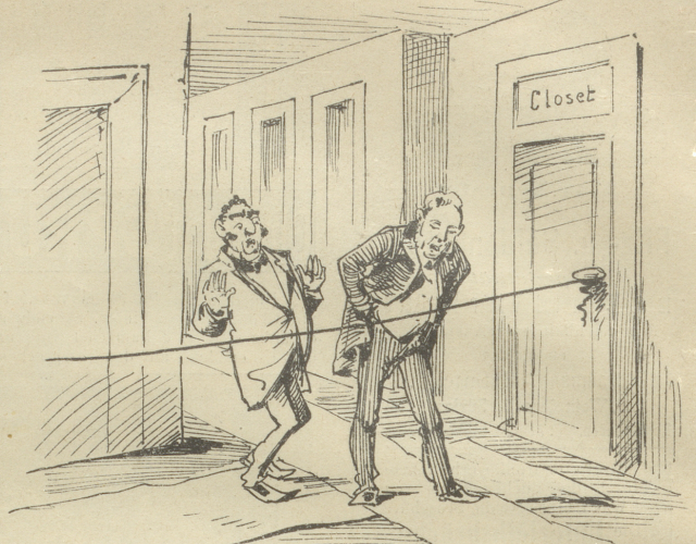
2. Jude: „Gott der Gerechte, wir sein gekommen unter die Raiber!“