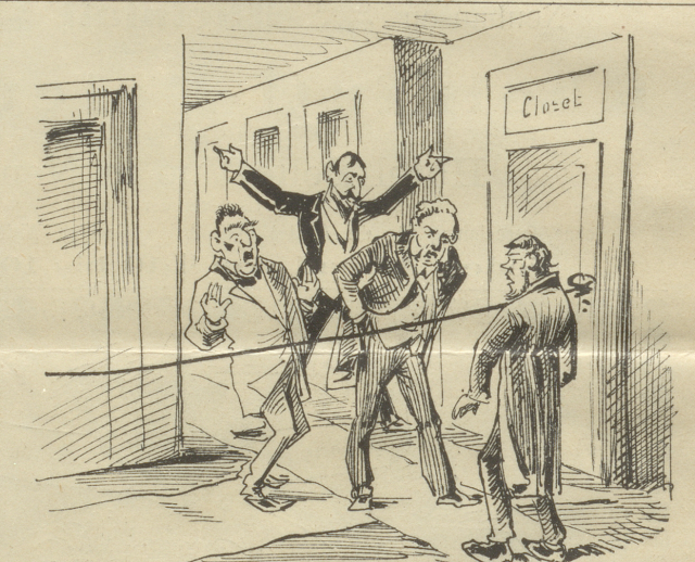
4. Schwabe: „Ha, wa isch denn dös?“