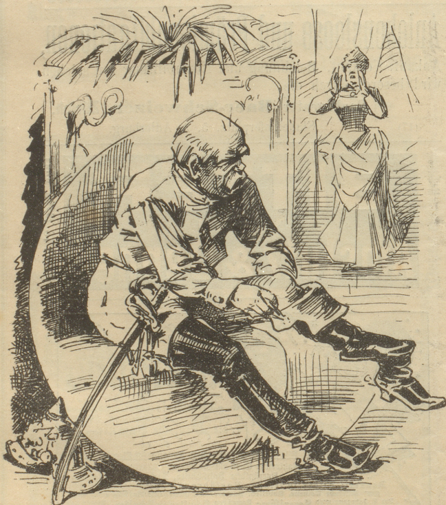
Die Fürstin: »Um Gottes Willen, Otto, die grossen Kanonen! Gibt's Krieg!« Bismarck: »Nein Schlimmeres: Preussischer Landtag!«