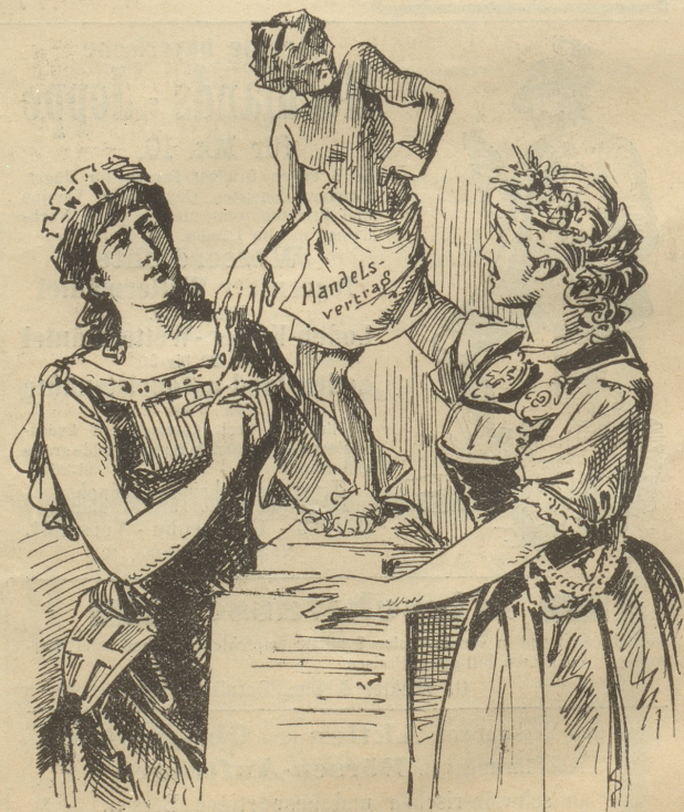
»O Jerum! Wie unendlich lang wir doch an dieser Figur herummodelliren müssen, bis sie schliesslich gar Niemandem gefällt. O Jerum!«