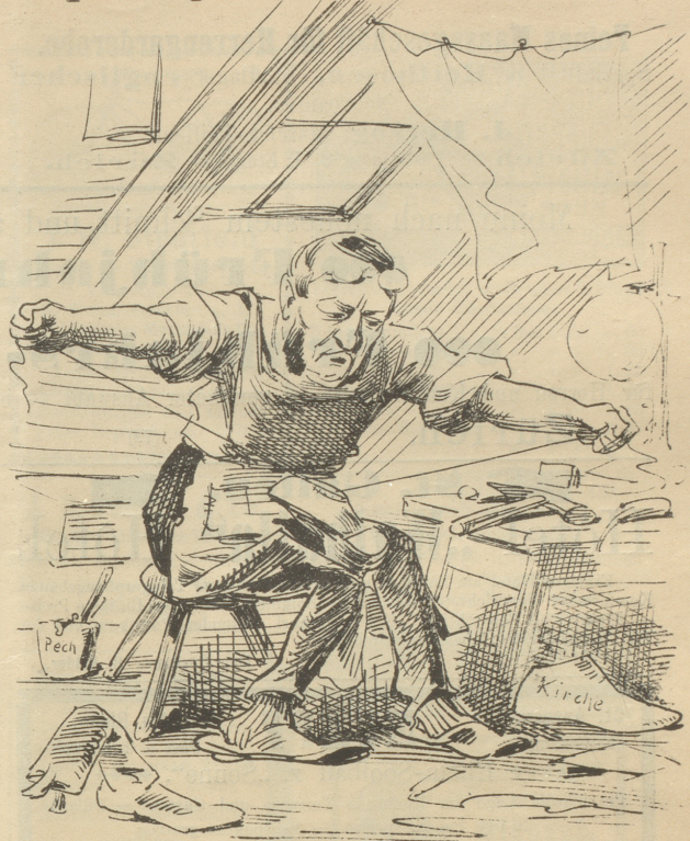
Stöcker: »Ich hab' zwar eine gute Haut, aber nun dennoch den politischen Rock ausgezogen. Es ist auch hübsch im eigenen Berufe der Regierung am Lederzeug zu ficken.«