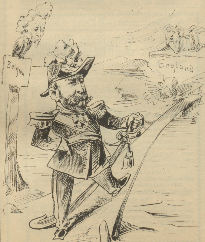
Als sich der Brav' général besann, ob er hinüber soll oder nicht, da rief ihm sein Rabe munter zu: »Wag's, wag's!«