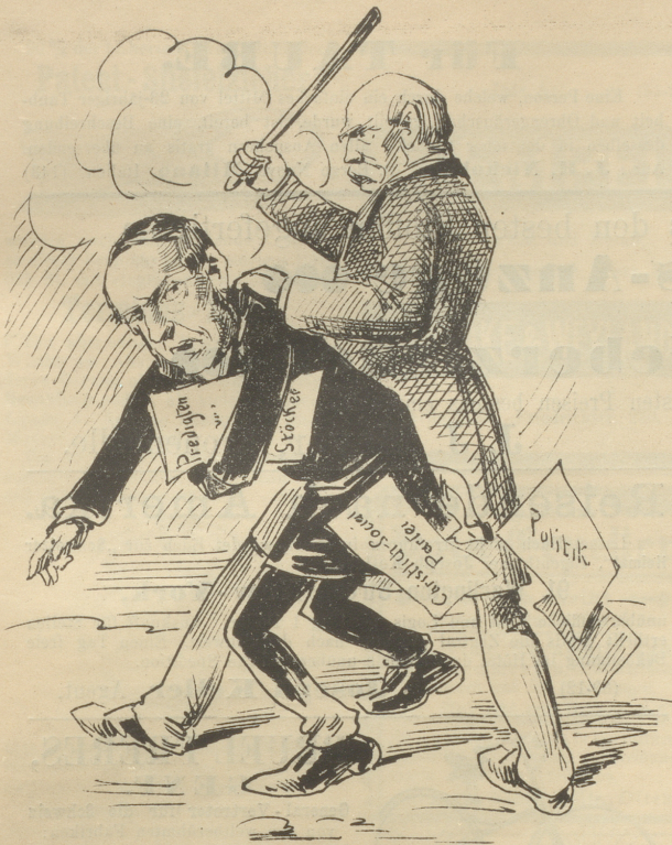
Bismarck: »Mein lieber Stöcker, den politischen Rock muss man von Zeit zu Zeit tüchtig stäuben. Zieh' ihn doch aus, wenn man drinn' bleibt, thut's weh!«