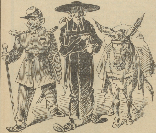
Die Unstifter der Freiburger Revolution.