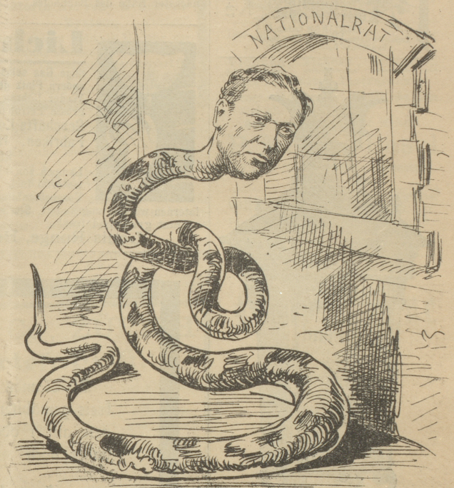
Steiger: „Schade, ich glaubte, ich könnte mich gleichwohl hineinschlängeln!“

Revolutionen zu unterdrücken, gibt es nur zwei Verfahren: