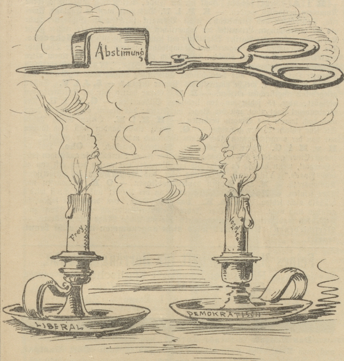
sucht ein Licht das andere auszuluhnen; höhere Mächte sind natürlich vorbehalten.