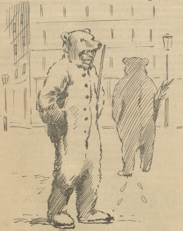
Ein flottes weißes Bärenfell, o gibt das warm! Warm selbst der eingefrorensten Seele;