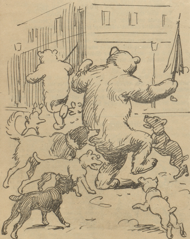
nur heißt es dann etwas aufpassen, wenn man auf die Straße kommt. Die Hunde lieben die Eisbären nicht.