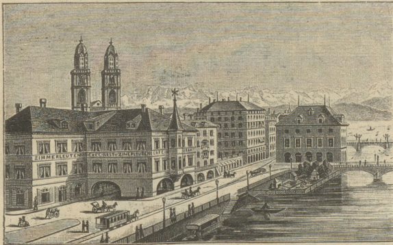
Table d'hôte 12 30 Uhr à 2 Fr. mit Wein. Dinners u. Soupers à la Carte. Hochzeits- und Gesellschafts-Essen werden auf's Prompteste ausgeführt.