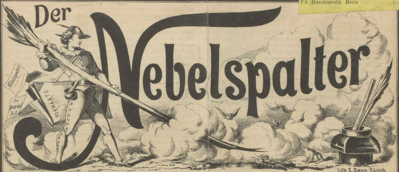
Lith. E. Senn. Zürich.