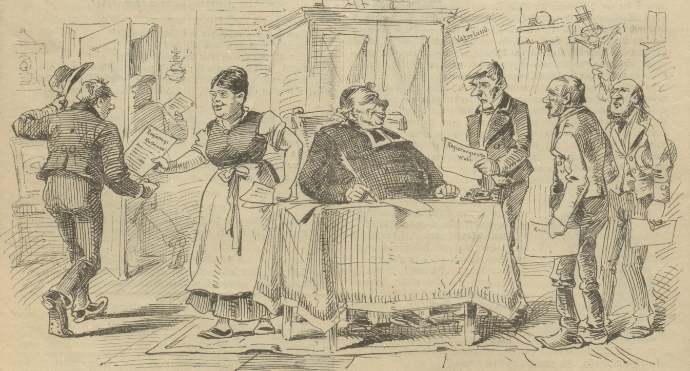
„Ja, unser Herr Pfarrer ist doch ein seelenguter Mann; er füllt uns die Stimmzettel selber aus, so daß wir damit gar Nichts mehr zu thun haben!“