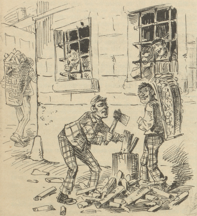
In Kalchrain zc. erhalten die schlechten Subjekte, welche arbeiten können, aber nicht wollen, „Pension“;