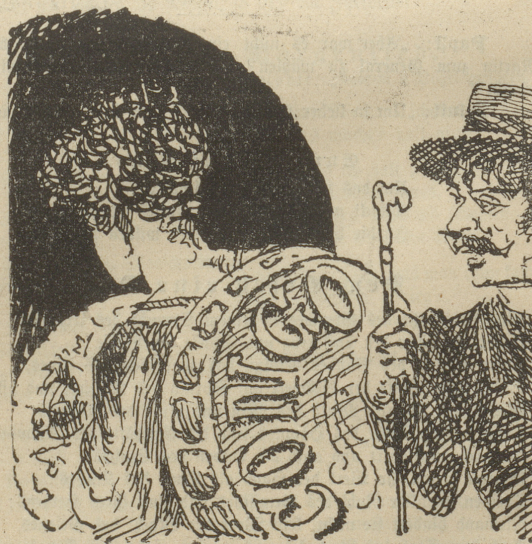
Früher wurden Bänder als Suivez-moi getragen, jetzt thut's eine afritanische Seifenschachtel.