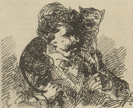
Wie der Bruder Zipfel seinen Comilitonen beweist, daß er nicht auf dem Hund sei.