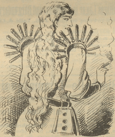
à la Cigarrenständer.