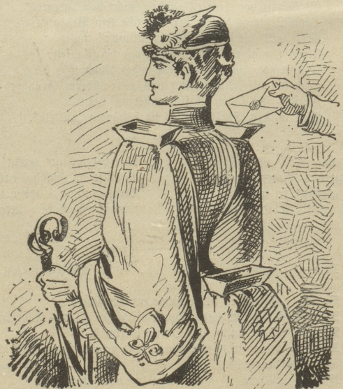
à la Briefeinwurf.