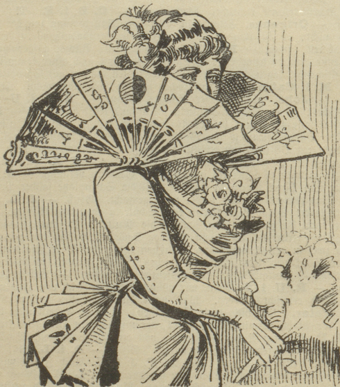
à la Fächer.