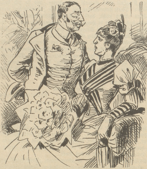
Von oben herab.

„Ist es wahr, Herr Brauswind sei mit einer Kunstreiterin verlobt?“ „„Allerdings, aber es ist eine Mesalliance .““