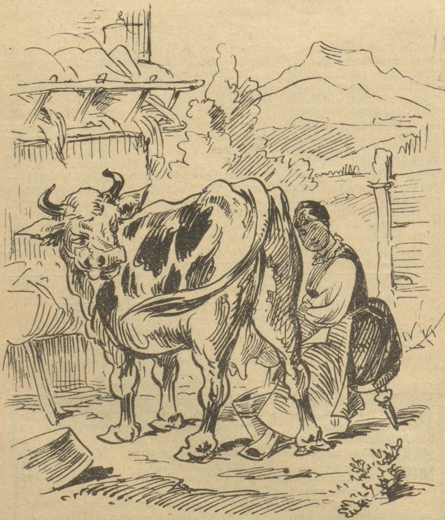
Bisher mußte man die Kühe so melken,