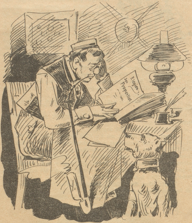
Einft wurde schwer aus Properz übersetzt