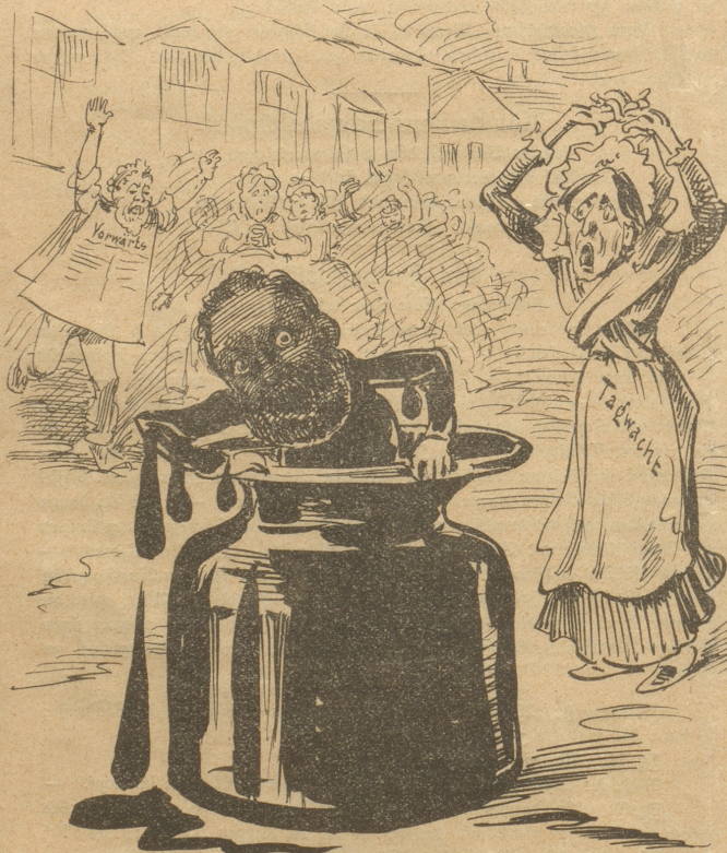
„Tafelwache“: „Der Knabe Karl fängt an, mir fürchterlich zu werden!“