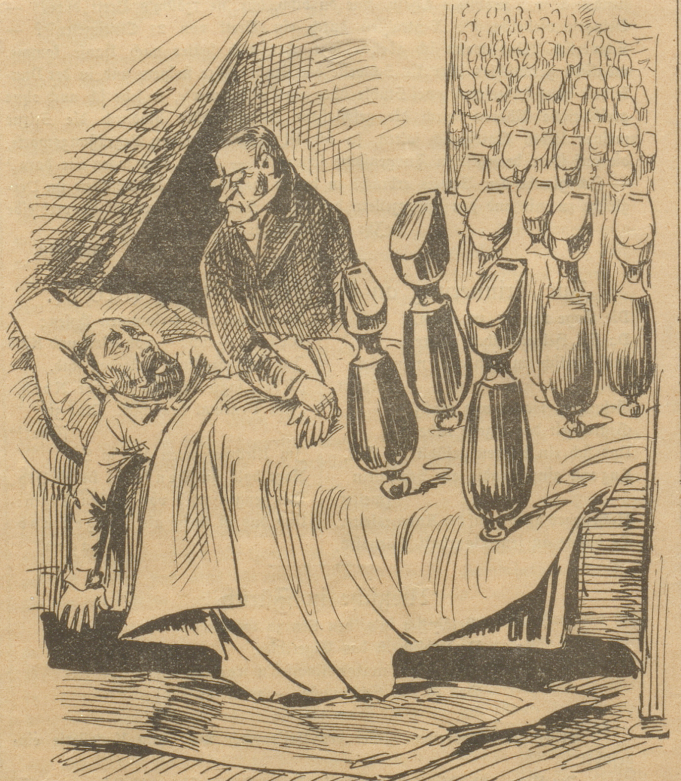
Arzt (zum fiebernden Eisenbahndirektor): „Herr Direktor, ich chan Ihre nüüd helfä, Sie händ d'Pfyfelikranket. Chünd Sie uf besserä, denn besserets scho!“