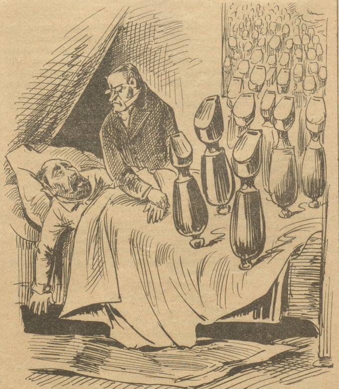
Arzt (zum fiebernden Eisenbahndirektor): „Herr Direktor, ich chan Ihre nüd helfä, Sie händ d'Pfyfelikranket. Chünd Sie uf besserä, denn besserets scho!“