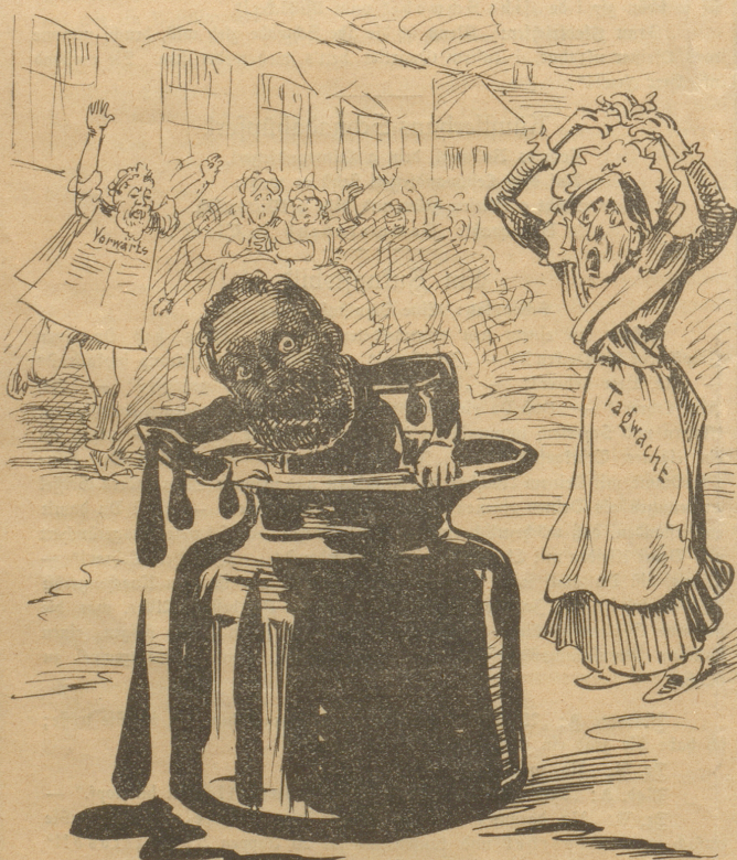
„Tafelwache“: „Der Knabe Karl fängt an, mir fürchterlich zu werden!“