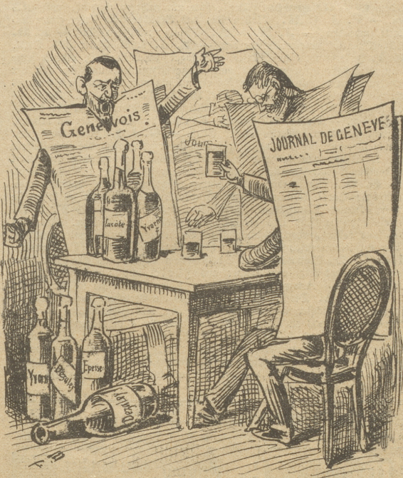
Der von den Genfern erhobene Kriegsruf: „Nieder mit den Waadtländern!“ begeistert selbst die Waadtländer.