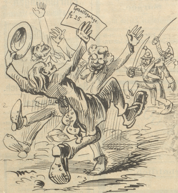
Die Schullehrer im Wallis sind über die ihnen gewährte Gehaltszulage von fr. 25 l pro Monat derart vergnügt, daß die Polizei angeboten werden mußte, um „öffentliches Vergerniß“ zu vermeiden.