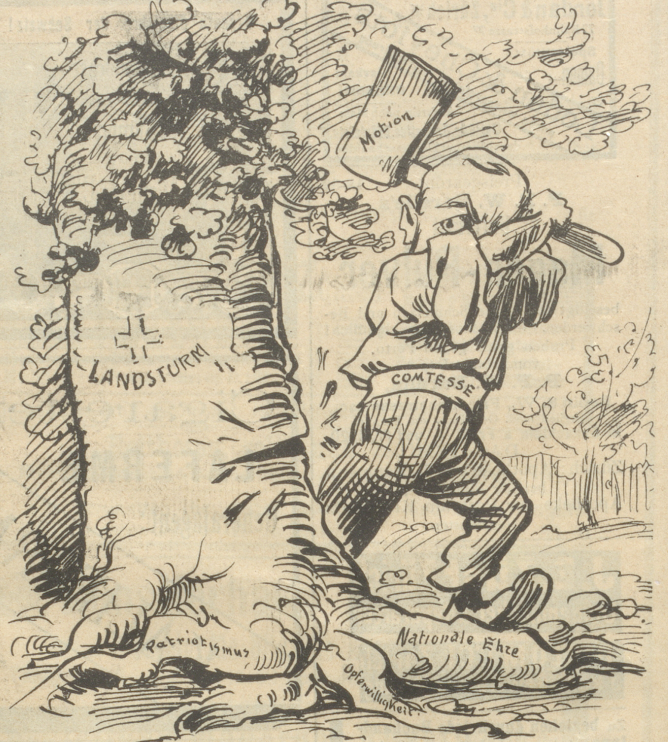
Der Axtschwinger: „Sapperment, wie kommt dees? Ich heisse doch Comtesse — und der verfluchte Baum scheint keinen Wanf auf meine Axtstiebe thun zu wollen.“