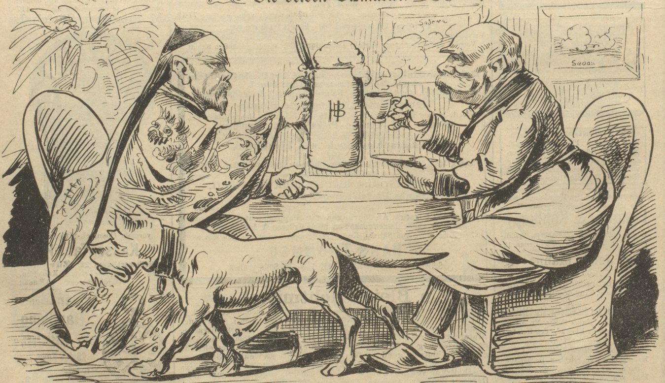
Li Hung-Tschang: „Herzliebster Kollege, was muß ich thun, um für China ein so strammes Heer herauszubringen, wie das deutsche?“