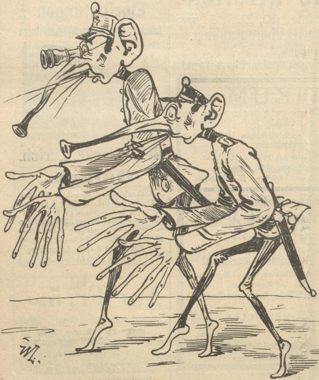
Wie ein richtiger französischer Spionenfänger aussehen muß, um größeren Erfolg zu haben.