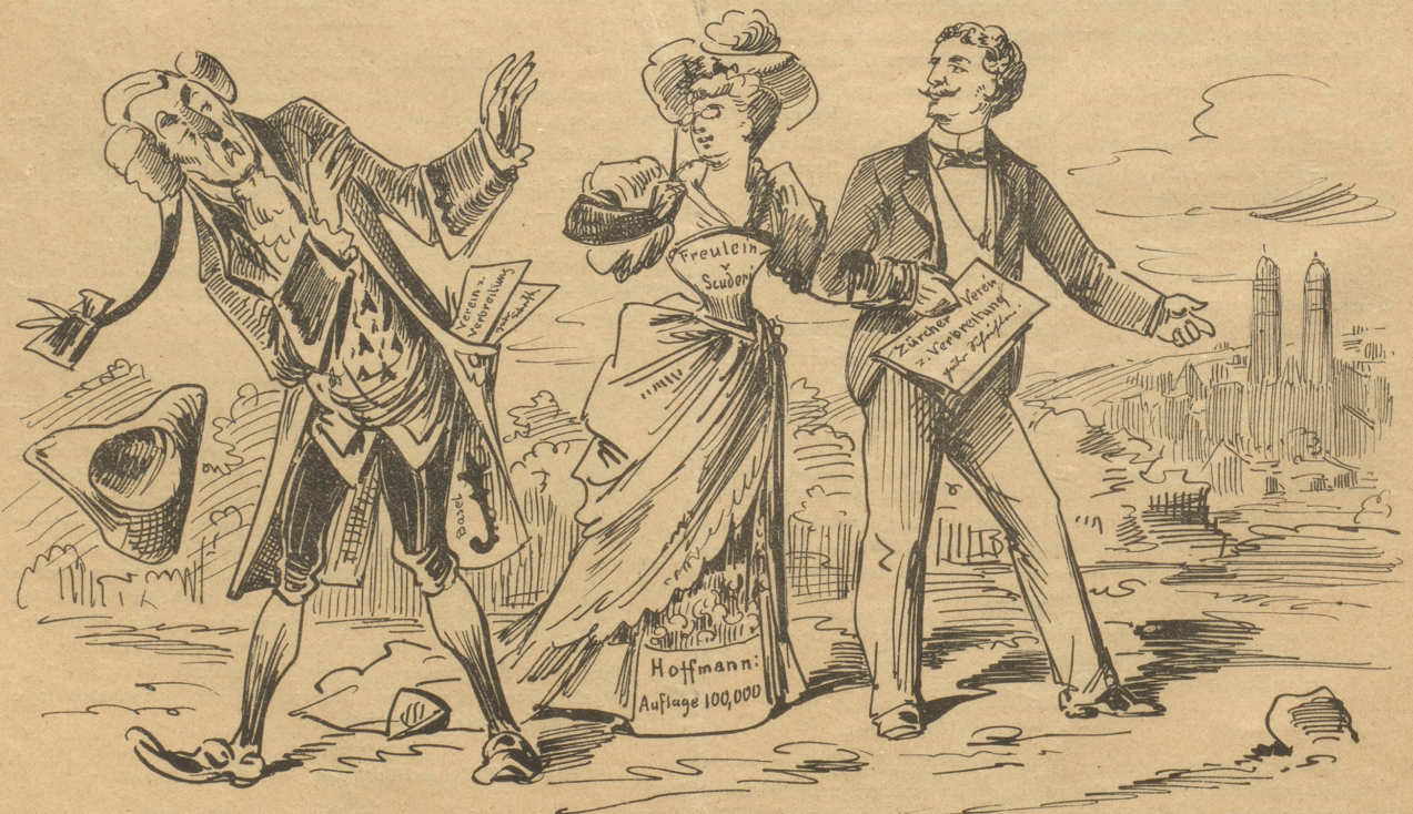
Nichts weiter als ein Beweis, daß sich um den guten Geschmack zuweilen doch streiten läßt.