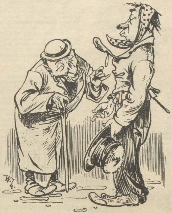
Angebettelter: „Ich gebe nichts, wir drei Miether haben es so verabredet.“ Bettler: „Da sind Sie auch ein schlechter Diplomat, wissen Sie denn nicht, daß ein Dreibund noch lange kein Treubund ist? Bitte!“