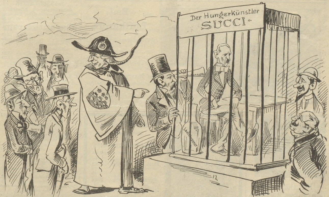
Wallis (zu seinen miserabel besoldeten Lehrern): „Nehmt Euch einmal ein Beispiel an dem da, meine Lieben. Sein Tischlein ist stets abgeräumt, er aber trotzdem immer aufgeräumt.“