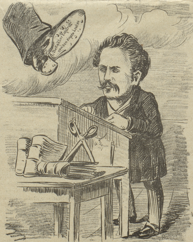
Seidel: „Ein hehres Gefühl ist es doch, je mehr man sich für andere opfert, um so sicherer darf man auf Lohn rechnen!“