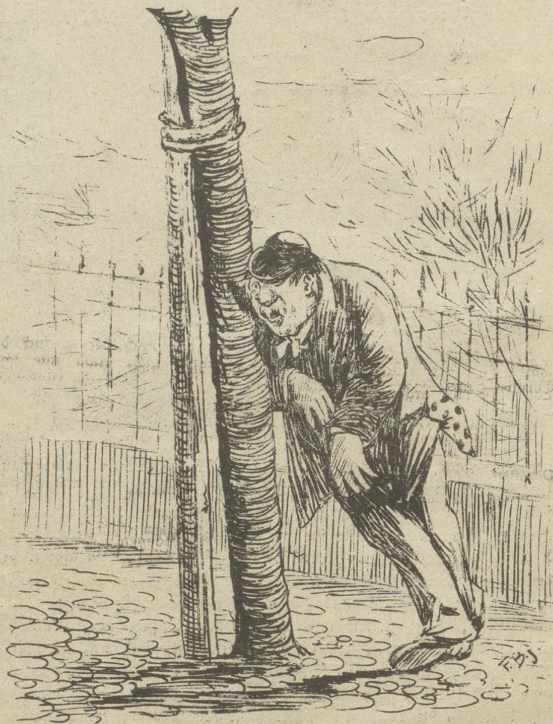
„Die sollen mir nur wieder kommen mit ihrem Sauser im Stadium! Ein aufrecht stehender Mann braucht sich so was nicht gefallen zu lassen!“