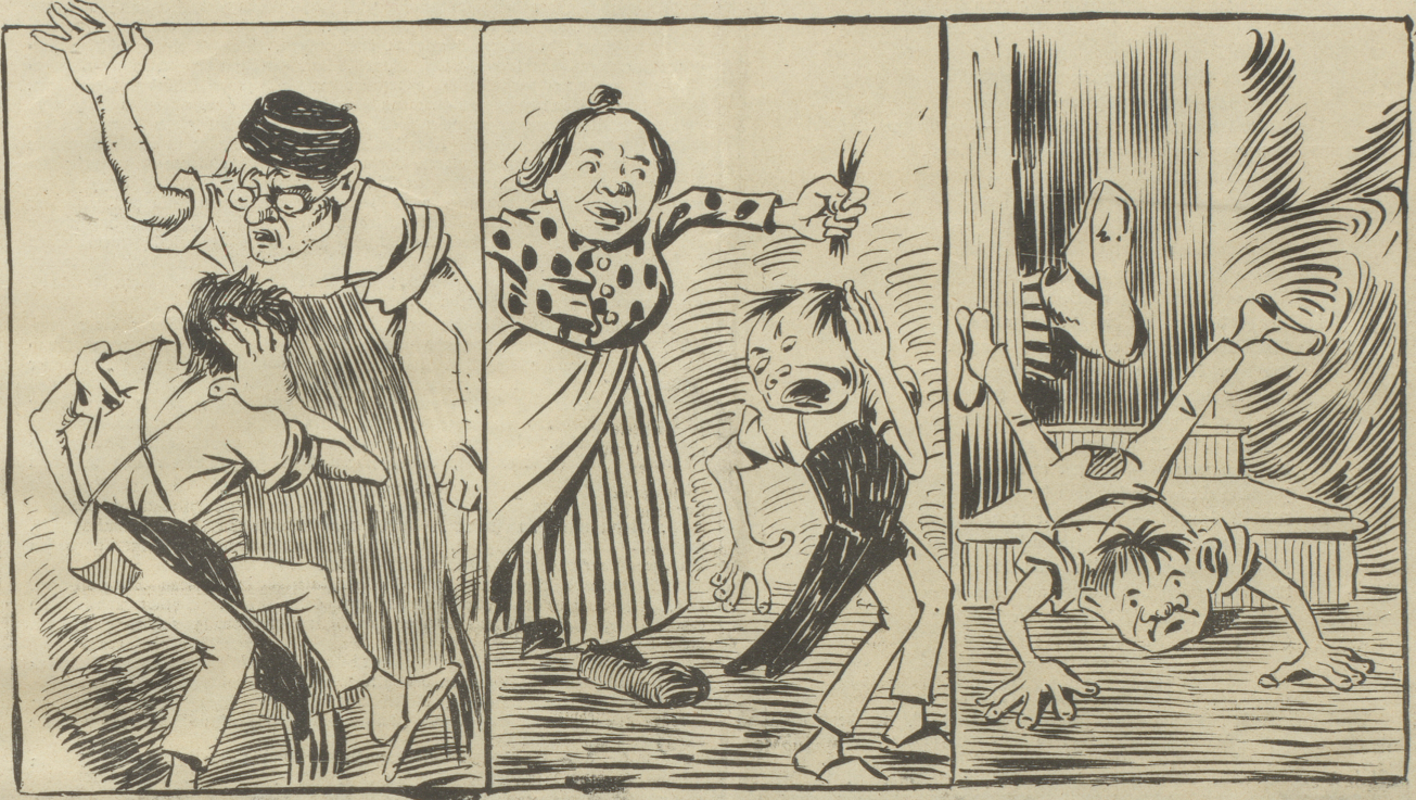
1. Er fängt an zu begreifen.